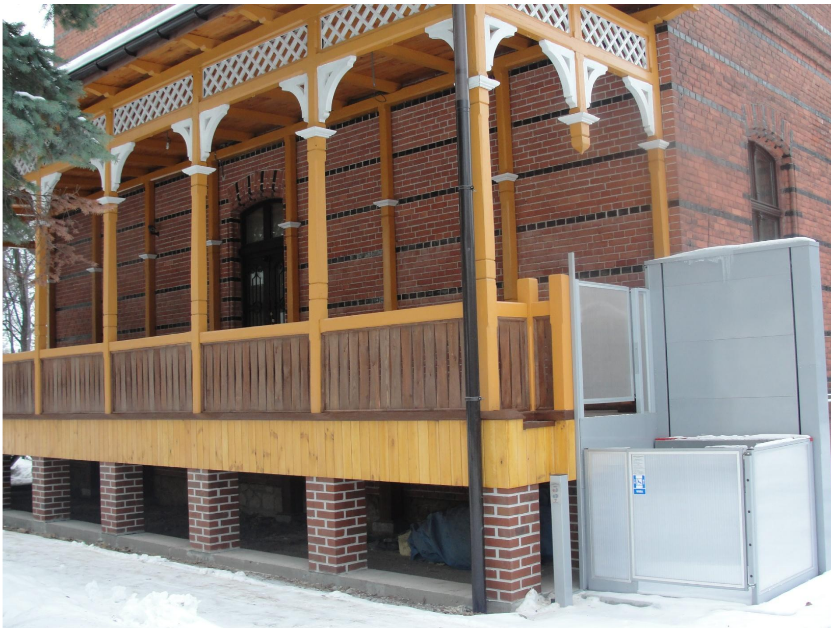
Biblioteka w Górniku