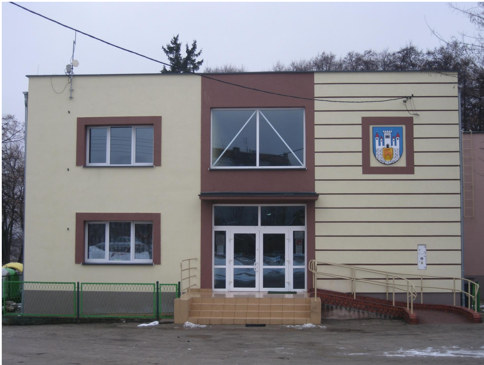
Biblioteka w Przemkowie