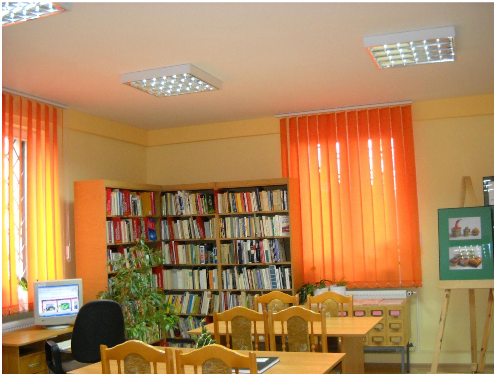
Biblioteka w Krężnicy