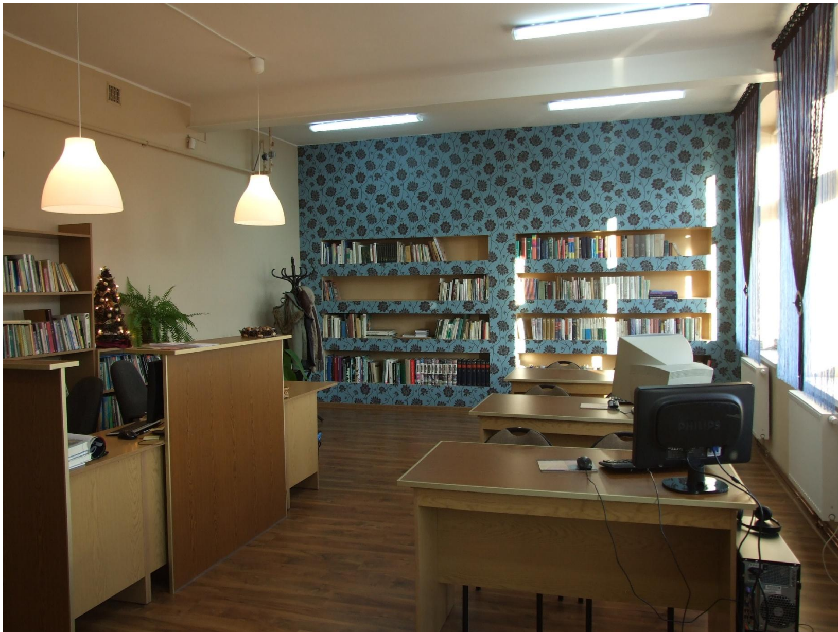
Biblioteka w Czarnej Wódzce