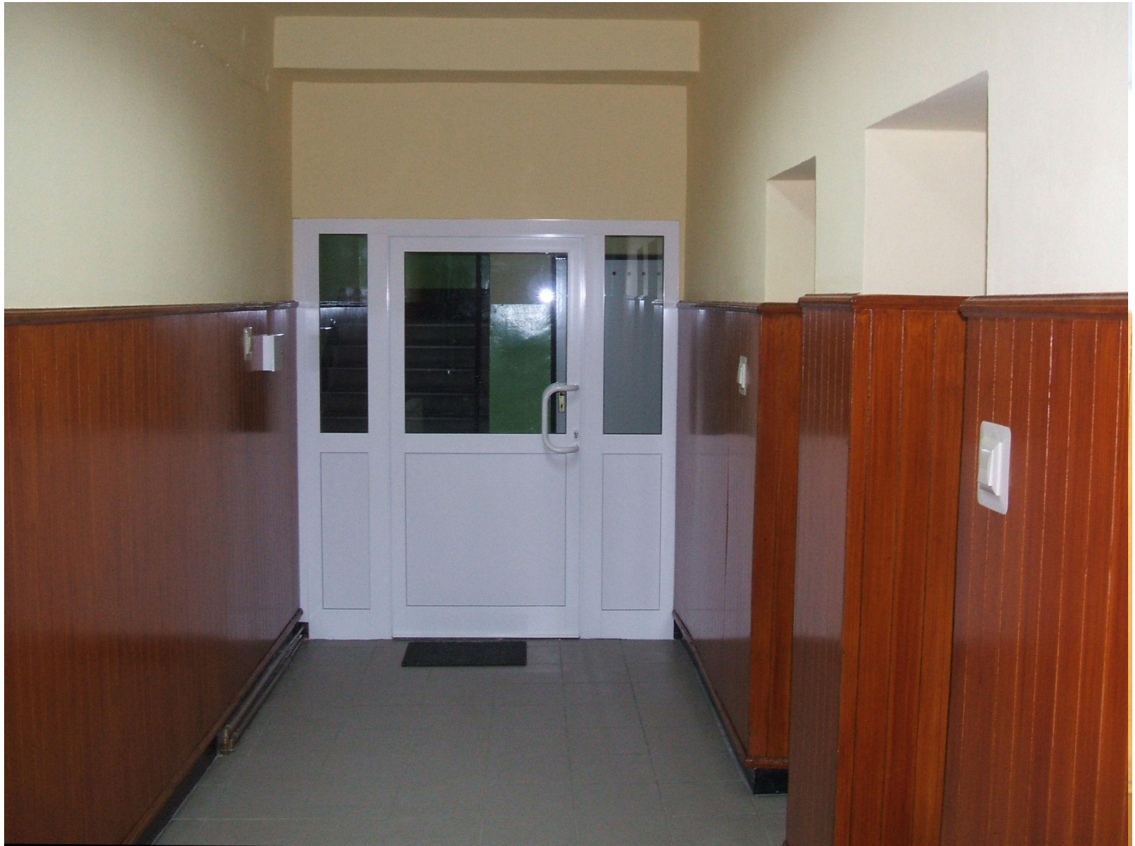
Biblioteka w Sierpcu