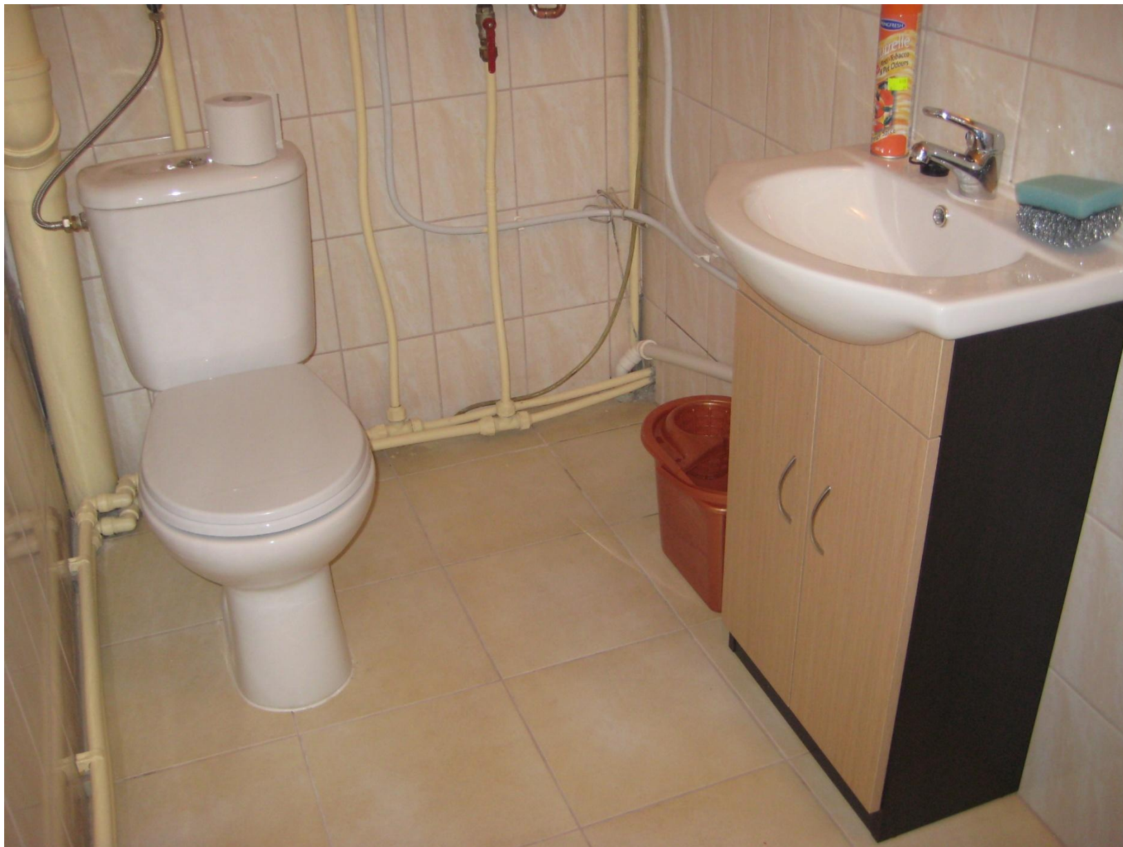
Biblioteka w Klimontowie