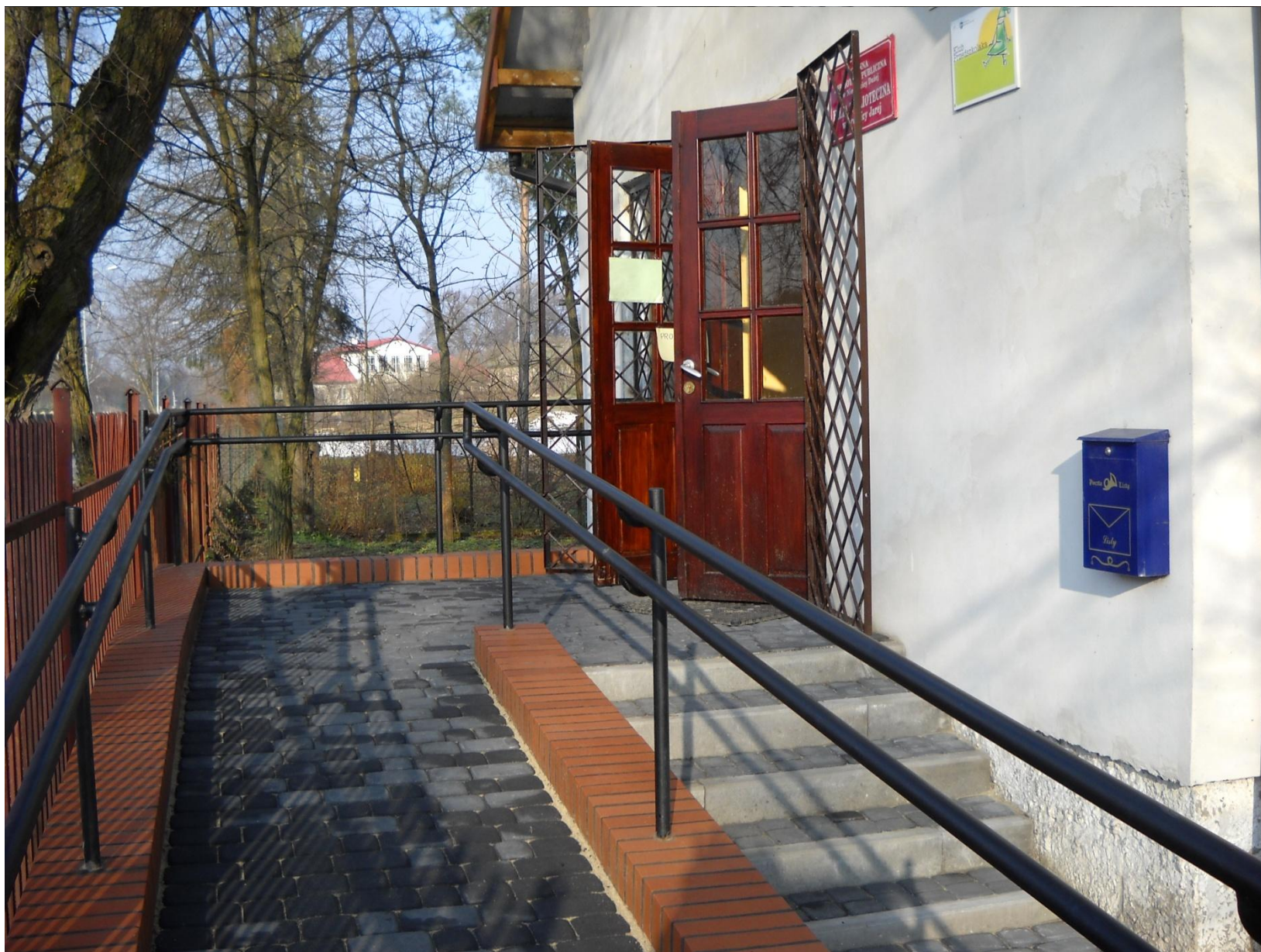
Biblioteka w Krężnicy