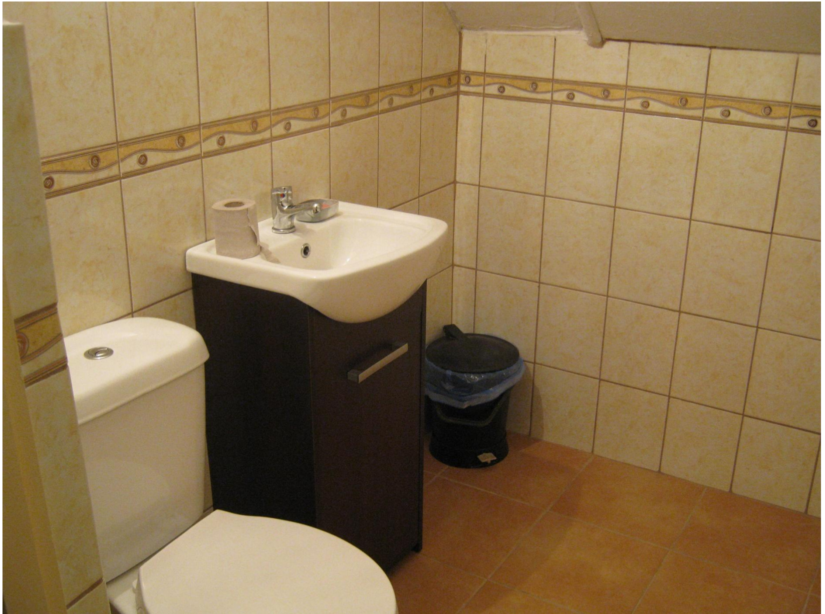
Biblioteka w Ostrorogu