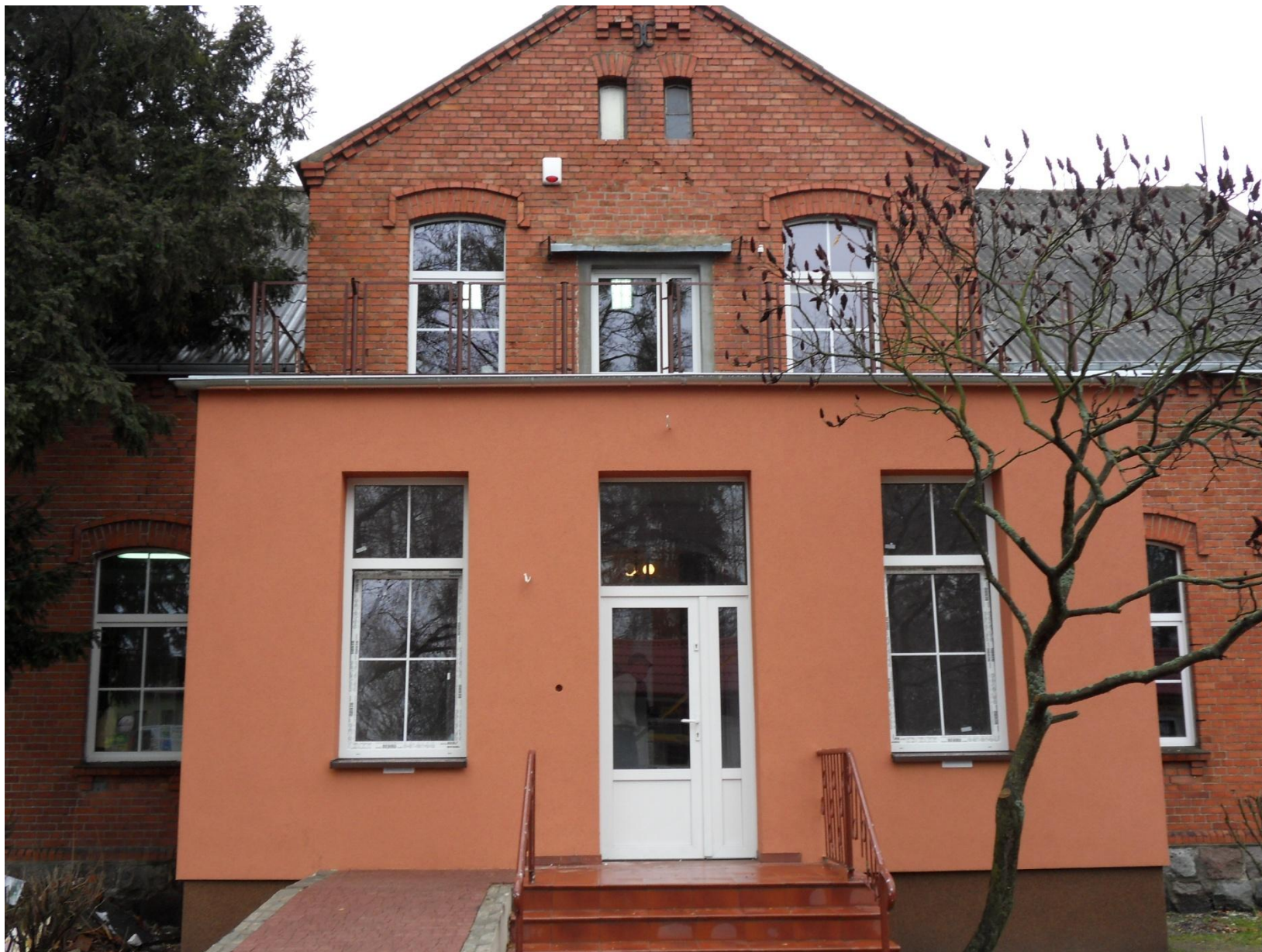
Biblioteka w Lnianie